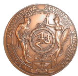
UNIVERSITÀ DEGLI STUDI DI PALERMO